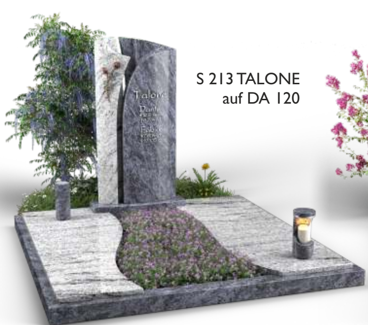
S 213 TALONE auf DA 120