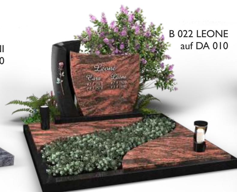
B 022 LEONE auf DA 010