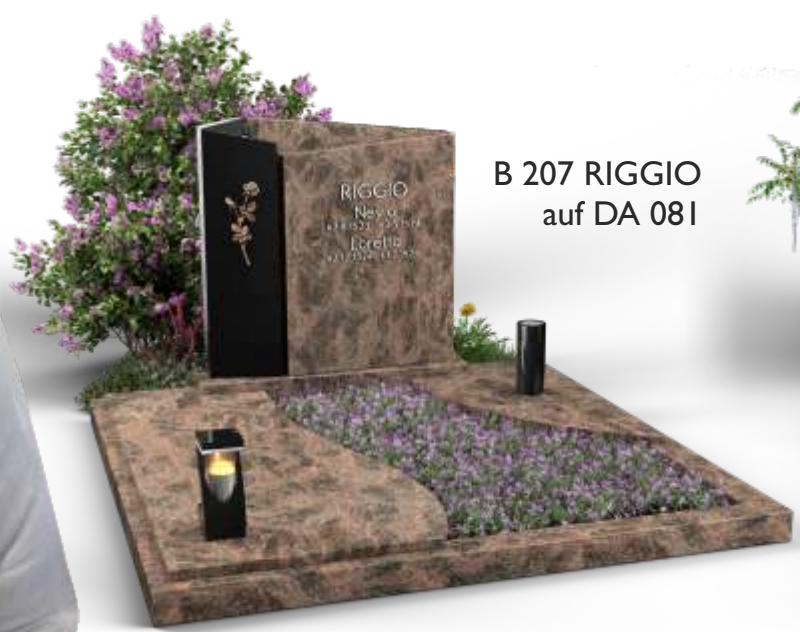
B 207 RIGGIO auf DA 081