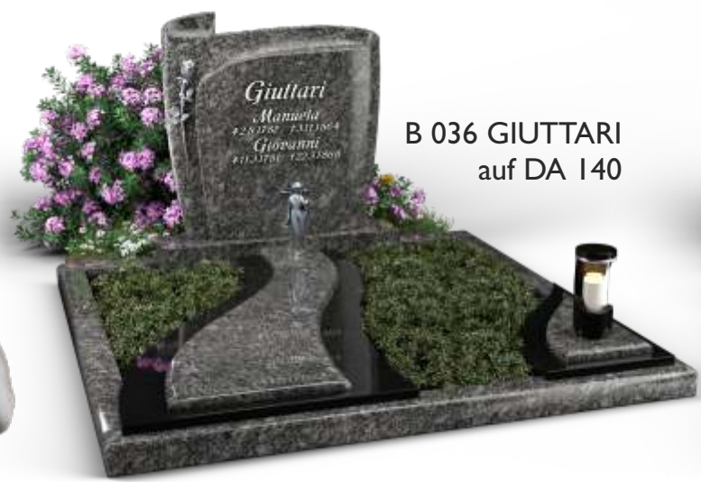
B 036 GIUTTARI auf DA 140