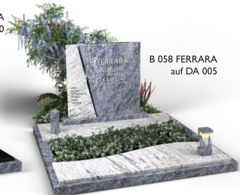
B 058 FERRARA auf DA 005