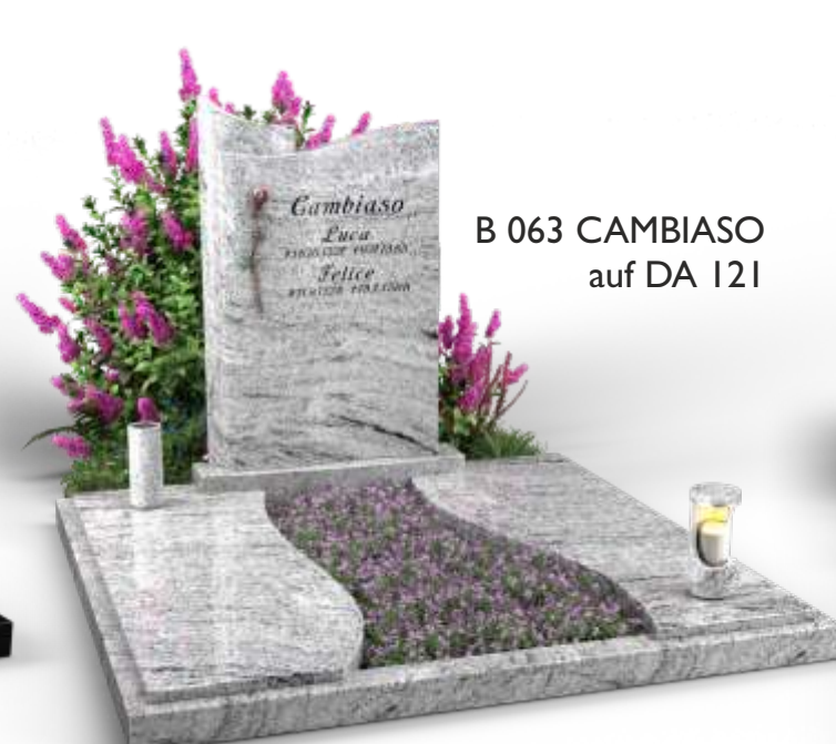
B 063 CAMBIASO auf DA 121