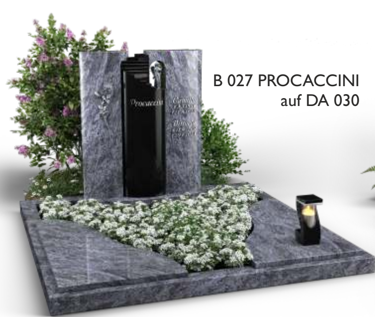
B 027 PROCACCINI auf DA 030