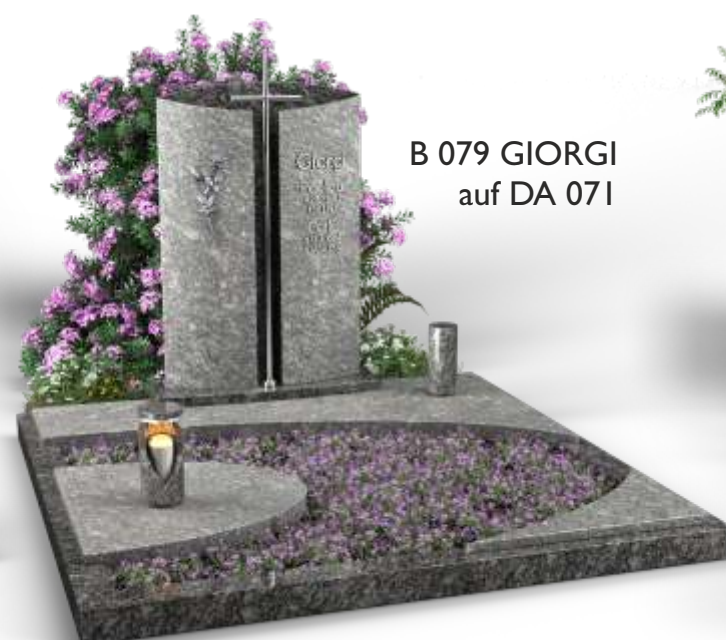
B 079 GIORGI auf DA 071