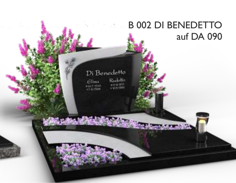
B 002 DI BENEDETTO auf DA 090