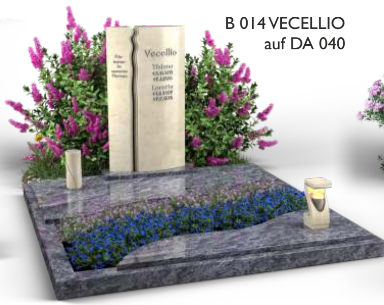
B 014 VECELLIO auf DA 040