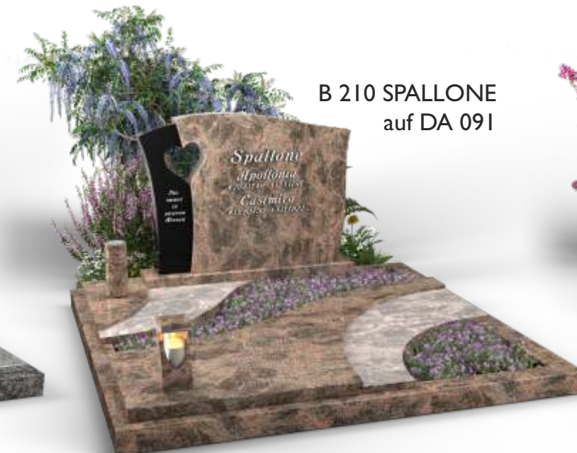
B 210 SPALLONE auf DA 091