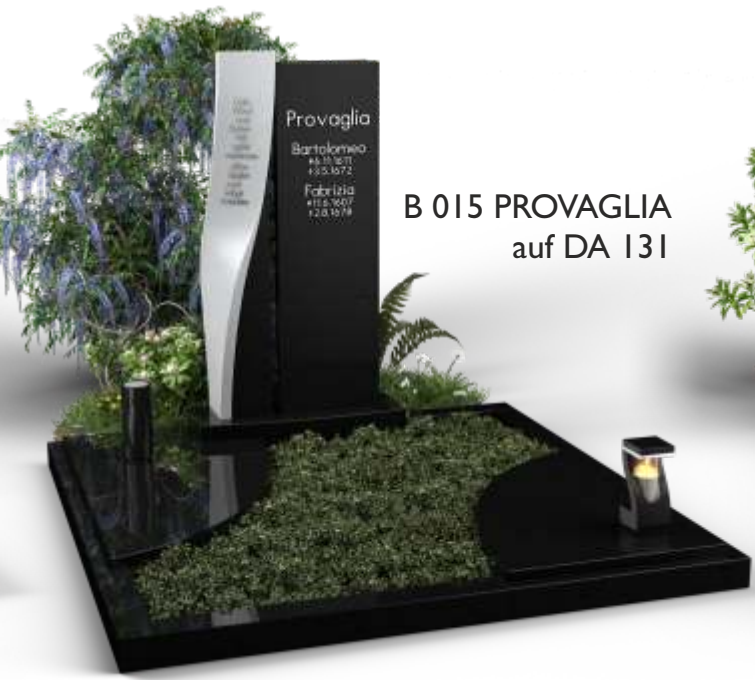
B 015 PROVAGLIA auf DA 131