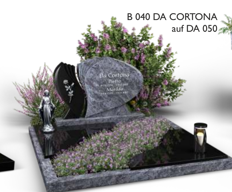
B 040 DA CORTONA auf DA 050