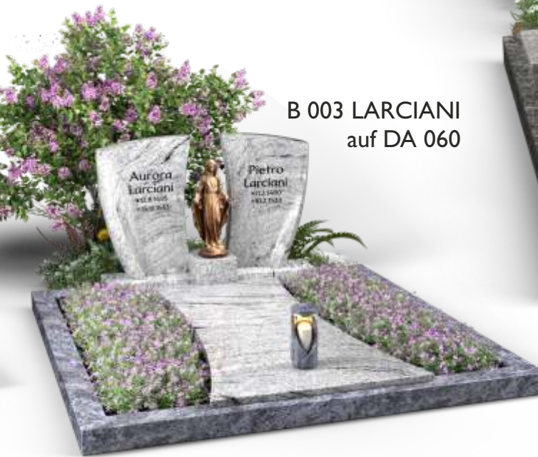
B 003 LARCIANI auf DA 060