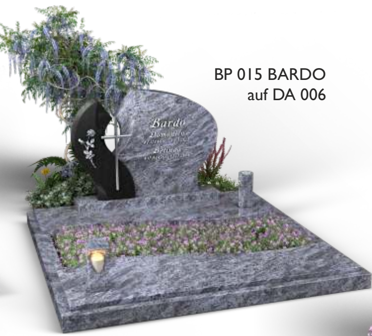
BP 015 BARDO auf DA 006