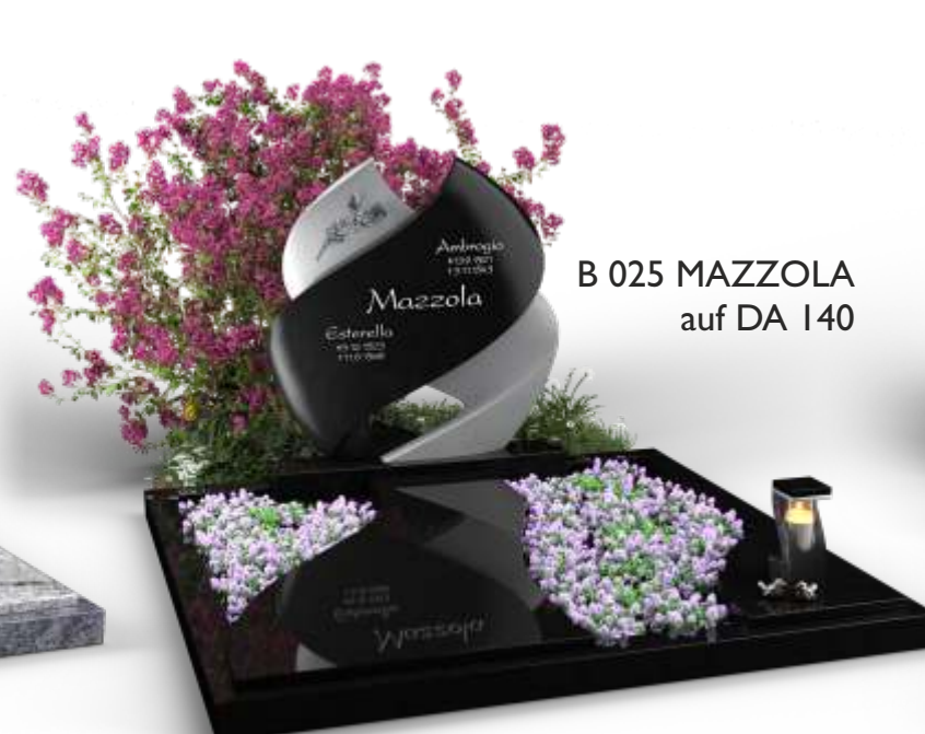
B 025 MAZZOLA auf DA 140