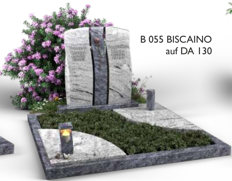
B 055 BISCAINO auf DA 130