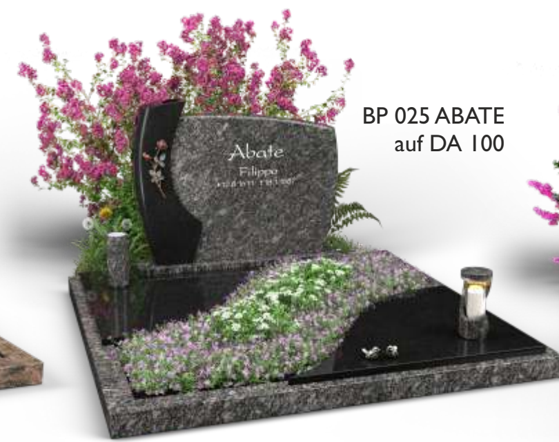
BP 025 ABATE auf DA 100