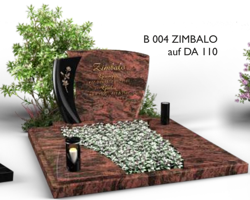
B 004 ZIMBALO auf DA 110