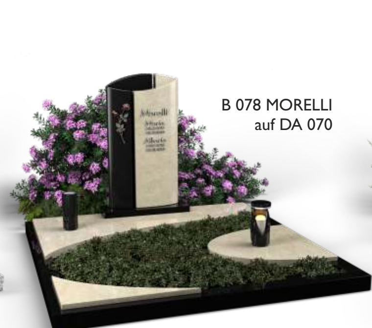
B 078 MORELLI auf DA 070