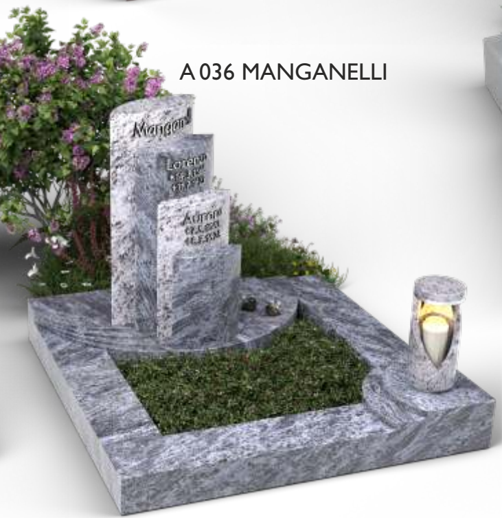
A 036 MANGANELLI