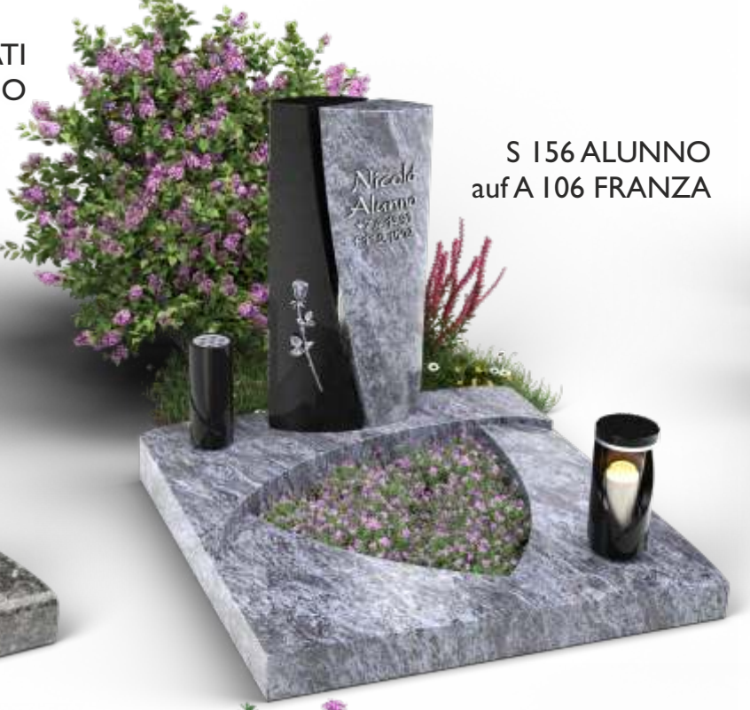
S 156 ALUNNO auf A 106 FRANZA