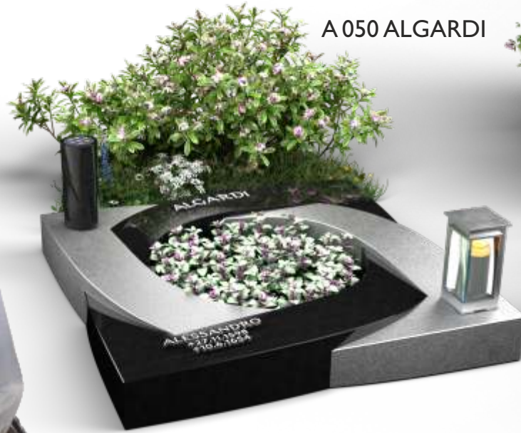
A 050 ALGARDI