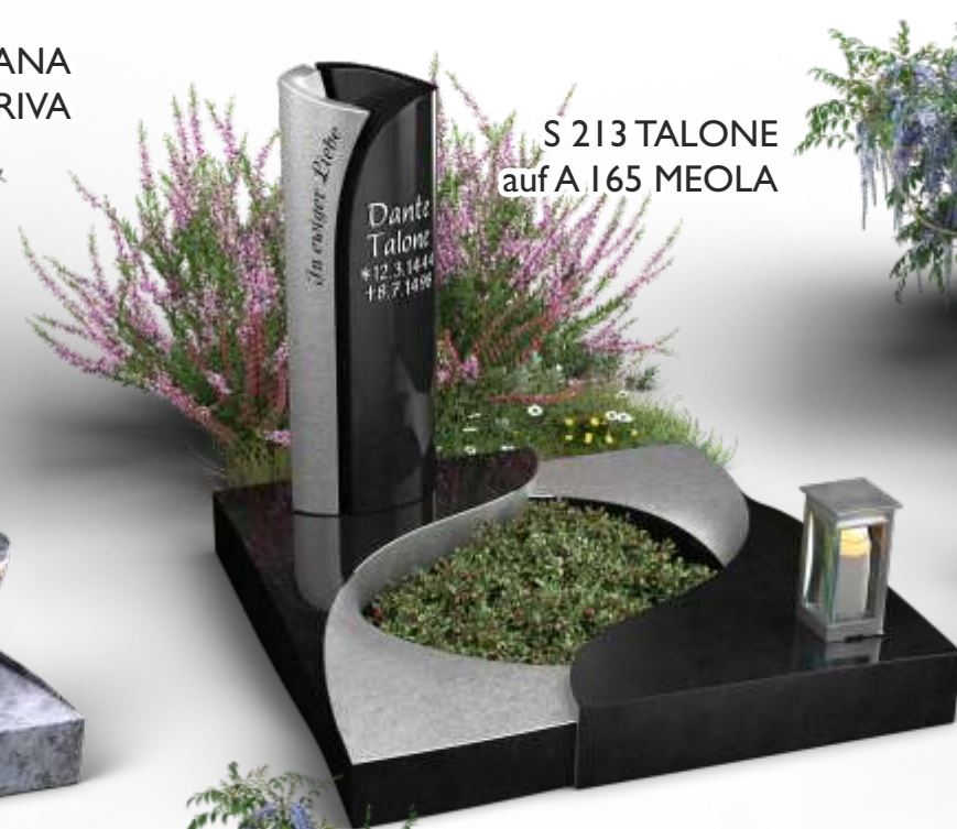
S 213 TALONE auf A 165 MEOLA