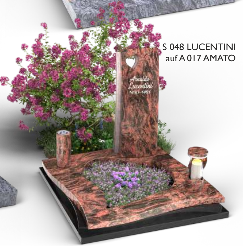
S 048 LUCENTINI auf A 017 AMATO