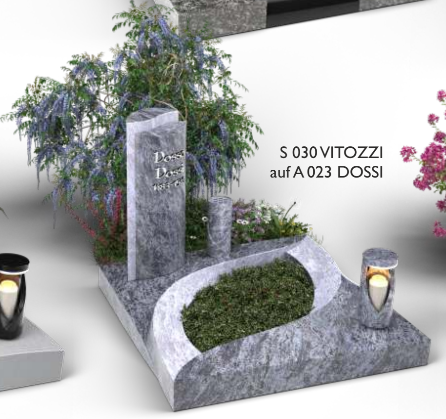
S 030 VITTOZZI auf A 023 DOSSI