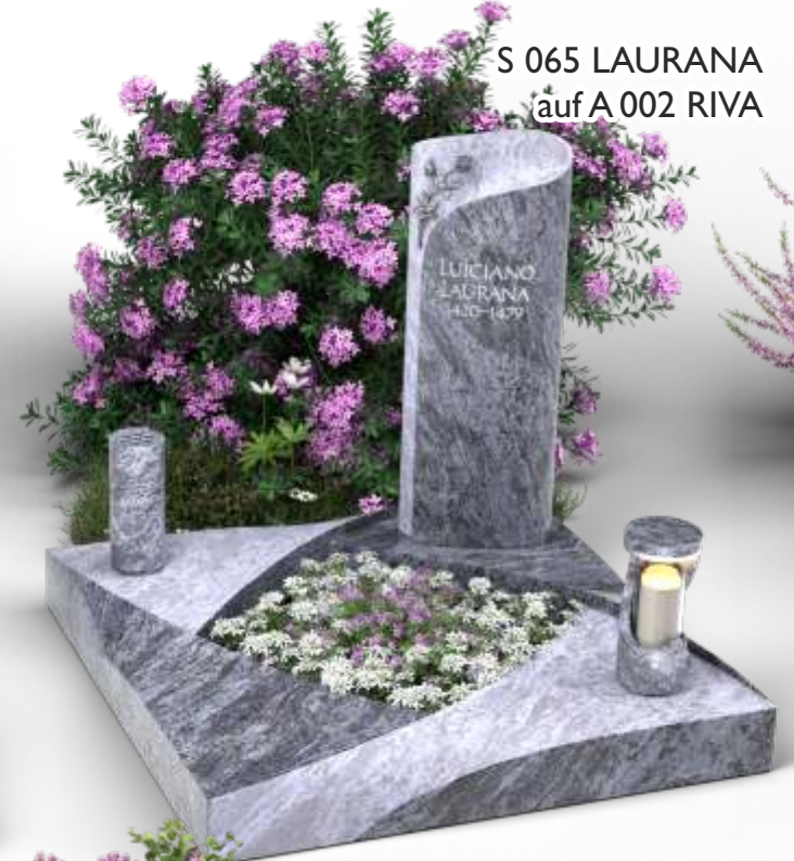
S 065 LAURANA auf A 002 RIVA