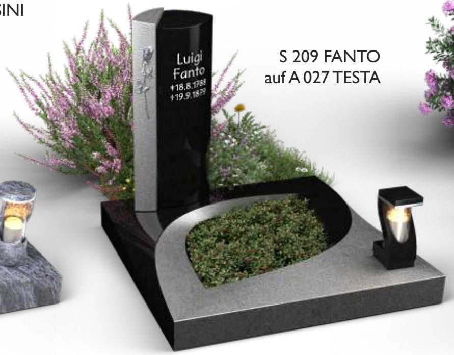
S 209 FANTO auf A 027 TESTA