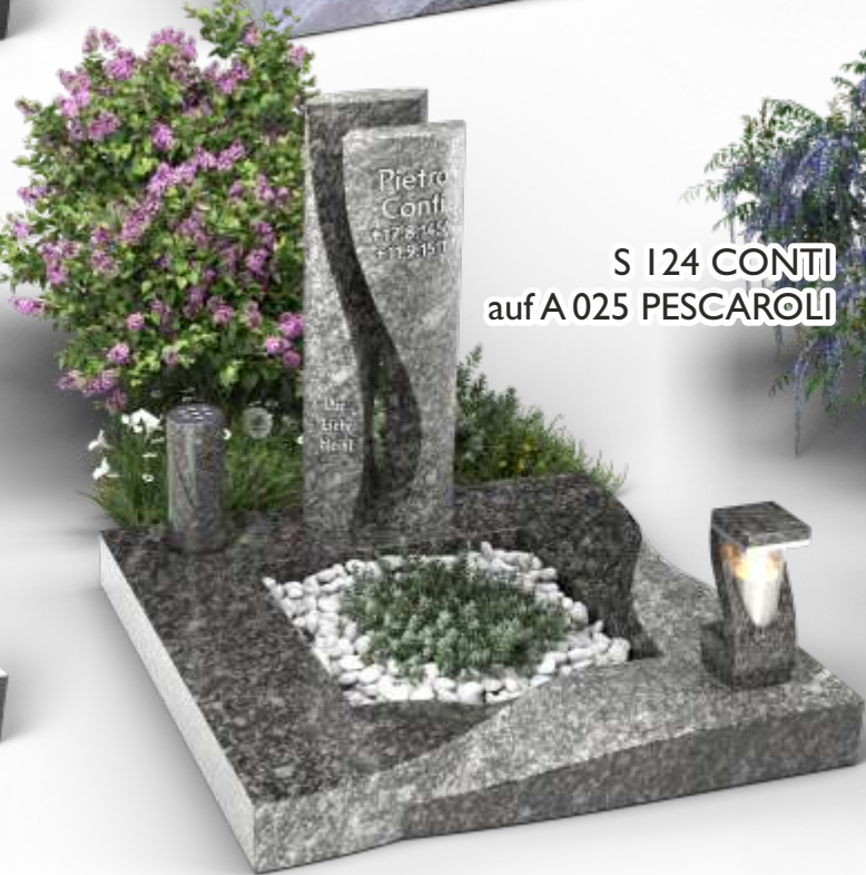
S 124 CONTI auf A 025 PESCAROLI