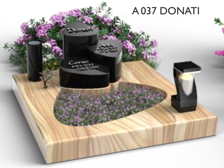
A 037 DONATI