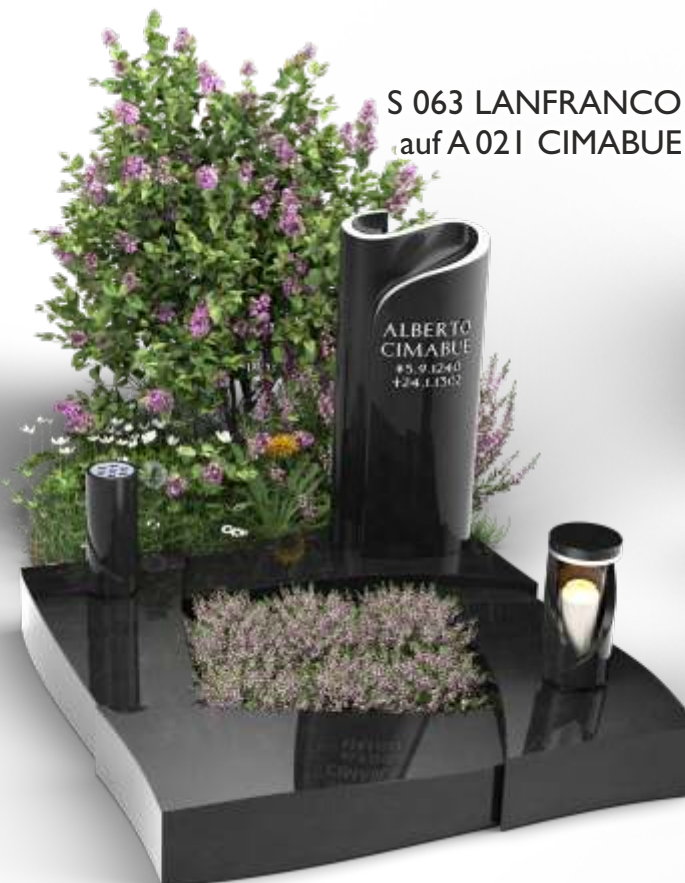
S 063 LANFRANCO auf A 021 CIMABUE