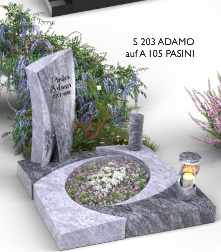
S 203 ADAMO auf A 105 PASINI