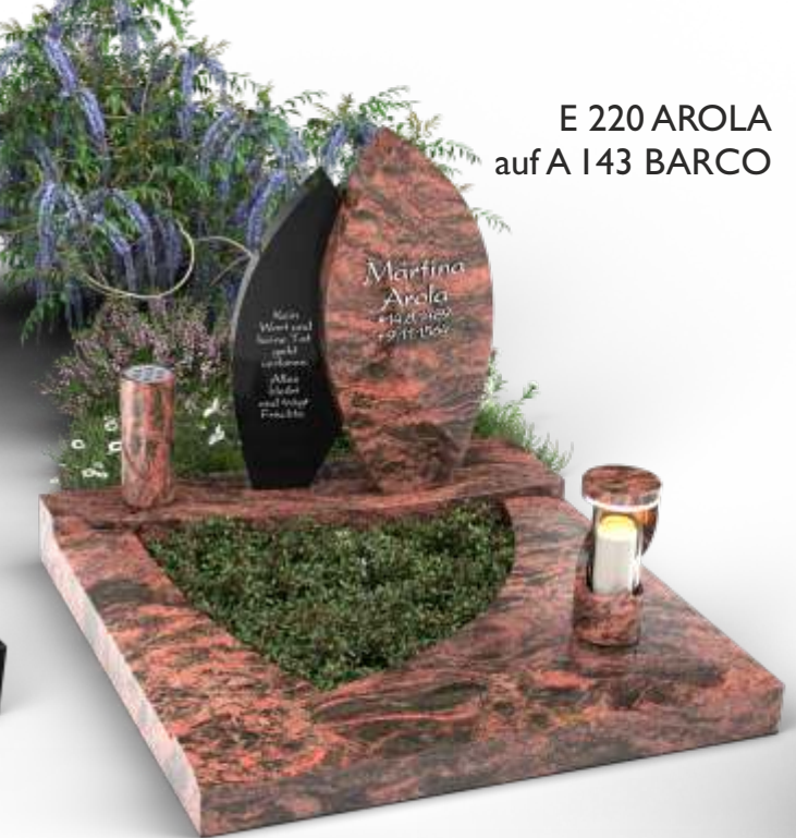
E 220 AROLA auf A 143 BARCO