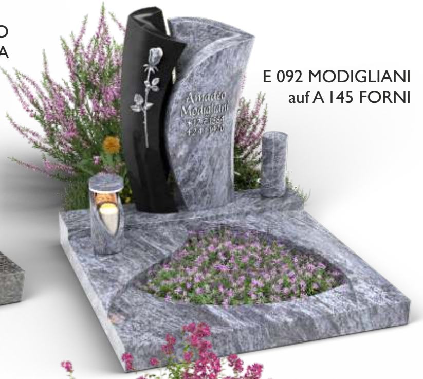
E 092 MODIGLIANI auf A 145 FORNI