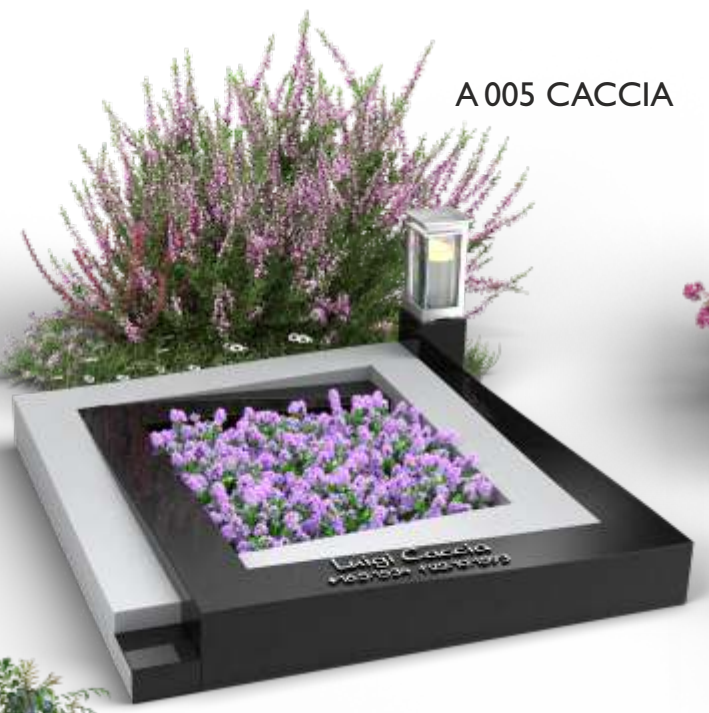
A 005 CACCIA