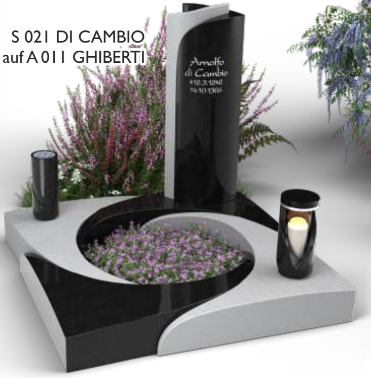
S 021 DI CAMBIO auf A 011 GIBERTI