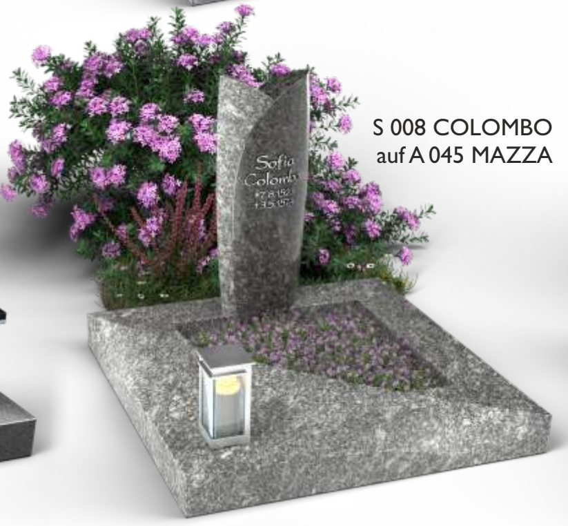
S 008 COLOMBO auf A 045 MAZZA