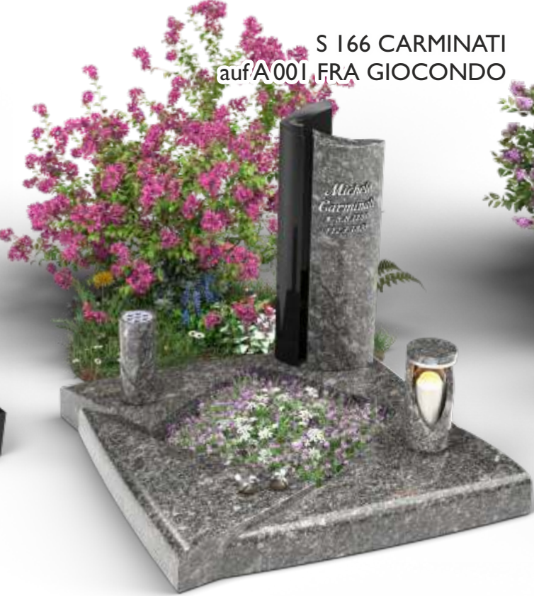
S 166 CARMINATI auf A 001 FRA GIOCONDO