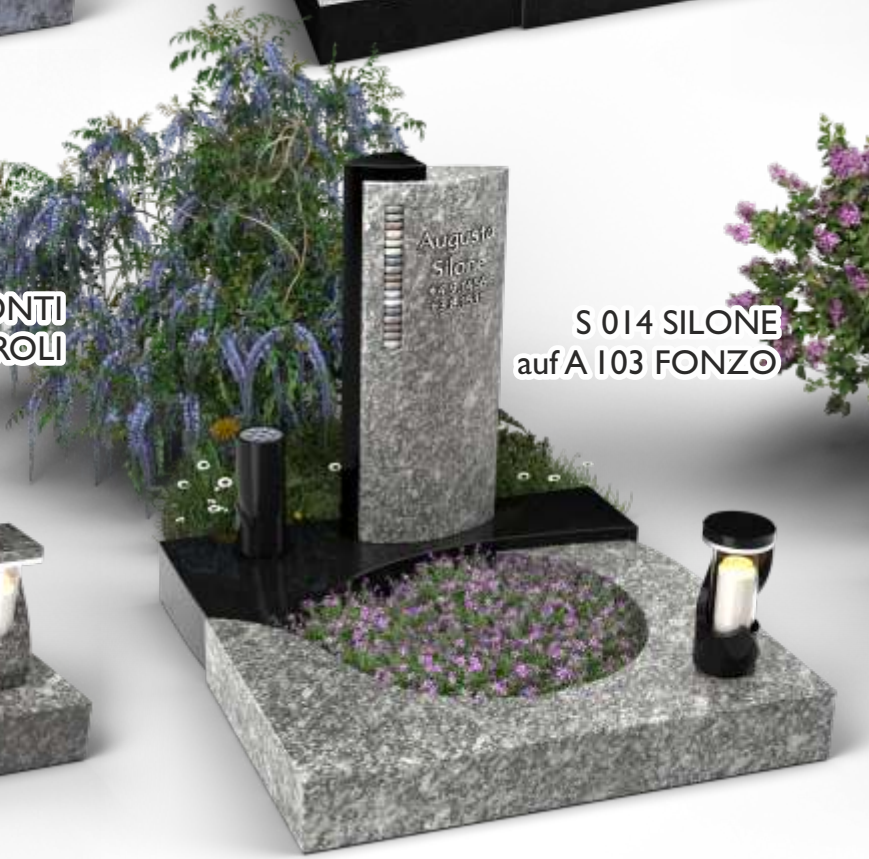
S 014 SILONE auf A 103 FONZO