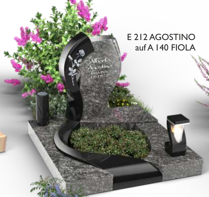
E 212 AGOSTINO auf A 140 FIOLA